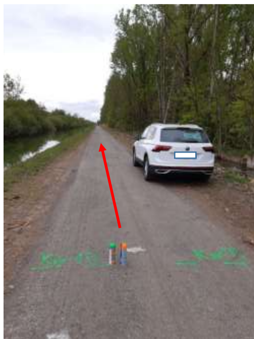
Km.15: Posto sulla ciclabile in Via Alzaia Pavese tra Nivolto e Ronchetto, frazioni del comune di Giussago